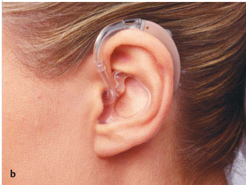
Abb. 59.4 Hinter-dem-Ohr-Hörgerät. (Starkey Laboratories (Germany) GmbH, Norderstedt)