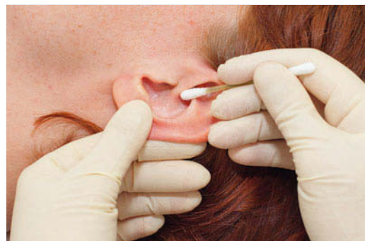
Abb. 59.1 Reinigung des äußeren Ohres.

Die Reinigung beschränkt sich auf die Ohrmuscheln und den Bereich hinter den Ohren. Das Einführen von Wattestäbchen in den Gehörgang ist verboten. Das Entfernen von Zerumen (Ohrschmalz) oder eines → Zeruminalpfropfes ist Aufgabe des Facharztes für Ohrenheilkunde.