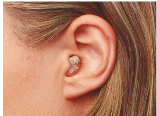
Abb. 59.5 In-dem-Ohr-Hörgerät.