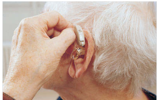
Abb. 59.6 Einsetzen des Hörgeräts. Ohrpassstück vorsichtig in den äußersten Gehörgang einführen. (Kellnhauser E. et al. Thiemes Pflege. Thieme; 2000)

me oder bei Nachlassen der geistigen Leistungsfähigkeit nicht in der Lage ist, das Hörgerät zu bedienen. In der Regel kennt sich der Patient selbst am besten mit seinem Hörgerät aus. Gründe für das Tragen eines Hörgeräts sind z. B. → Altersschwerhörigkeit , → Lärmschwerhörigkeit und die Schwerhörigkeit nach einem → Hörsturz .