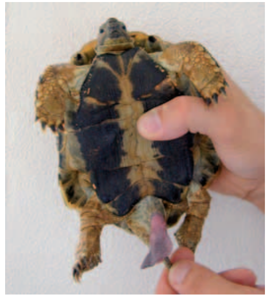
► Abb. 14.1 Vorlagerung des Hemipenis bei einer Landschildkröte. (Klinik für Vögel und Reptilien, An den Tierkliniken 17, 04103 Leipzig)

Bei weiblichen Tieren stellt der Vorfall von Oviduktgewebe eine Komplikation im Zusammenhang mit der Legetätigkeit dar, welche meist durch Störungen im Legeprozess (S.254) bedingt ist. Der Ovidukt kann durch Schwellungen, Infektionen