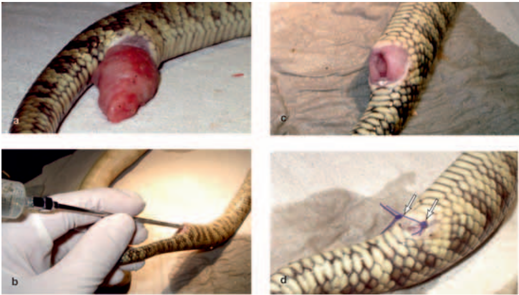
► Abb. 14.6 Darmprolaps bei einem Amethystpython mit Flagellatenbefall. a Klinisches Bild. b Vorsichtige Zurückverlagerung mithilfe einer Sonde und Spülflüssigkeit. c Rückverlagerter Darm und geschwollene Kloake. d Einsatz von zwei Einzelheften zur Kloakenverengung. (Klinik für Vögel und Reptilien, An den Tierkliniken 17, 04103 Leipzig)