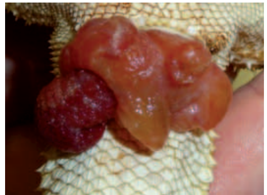
► Abb. 14.2 Hemipenisprolaps bei einer Bartagame. Neben dem fleischigen Hemipenis hat sich auch ödematöses Gewebe gebildet.

und Ödeme stark verändert sein. Unverändert ist meist eine Längsstreifung zu erkennen, die die Abgrenzung zum Darm ermöglicht ( ► Abb. 14.3 ). Im Zweifelsfall kann eine Röntgen- ( ► Abb. 14.4 ) oder Ultraschalluntersuchung helfen, Eier im vorgefallenen Gewebe zu erkennen und den Ovidukt bes-