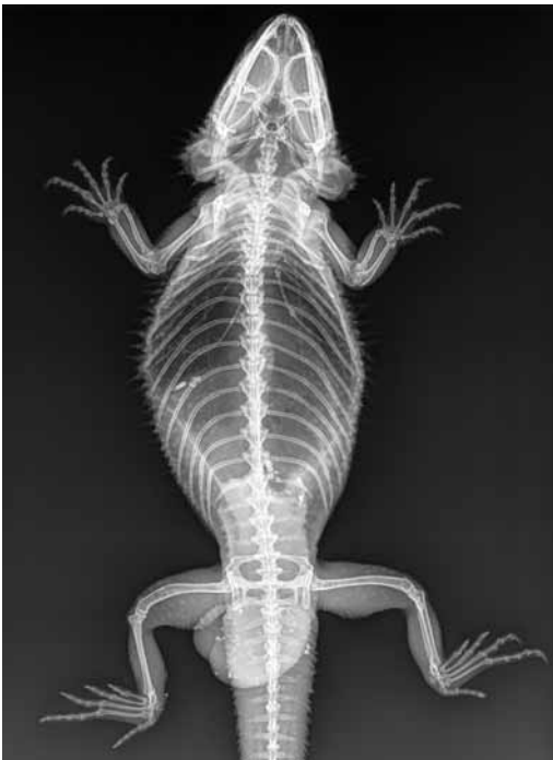
► Abb. 14.4 Röntgenaufnahme (dorsoventrale Projektion) einer Bartagame: aus der Kloake prolabiertes Gewebe, Ovidukt mit Ei.

ser von einem anderen Gewebevorfall abzugrenzen.