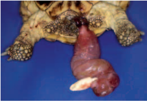
► Abb. 14.3 Vorfall des Ovidukts bei einer Landschildkröte.