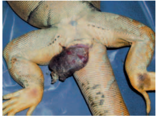
► Abb. 14.5 Darmprolaps bei einem Grünen Leguan.