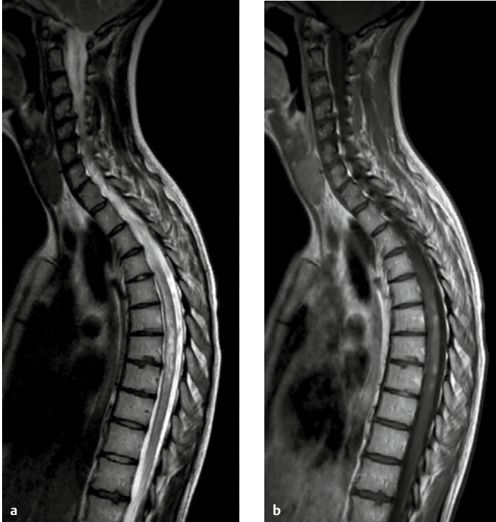
Abb. 99.1 MRT der BWS. a T2 sagittal. b T1 mit KM sagittal.

Bei der angeforderten Bildgebung ergibt sich der in Abb. 99.1 dargestellte Befund.