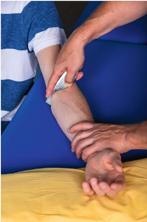
Abb. 4.4 Querreibungen mit dem Haken von Fazer 1 am Ellenbogen.