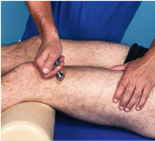
Abb. 4.12 Tonusregulierungstechnik mit Fazer 4 im Bereich des lateralen Oberschenkels.

Häufig reicht der rein vertikale Druck nicht aus, um eine Abnahme der Spannung zu erreichen. Dann sollte die Technik minimal angepasst werden: Im Bereich der maximalen Spannung führt der Therapeut kleine seitliche Bewegungen durch, während er den Druck hält. In dieser „schmelzenden“ Technik kann das Release auch durch kreisende Bewegungen mit geringem Durchmesser erreicht werden. Wichtiger als die Bewegungsrichtung ist die Geschwindigkeit mit der die gesamte Technik durchgeführt wird. Um eine Entspannung zu erreichen, ist eine geringe Geschwindigkeit zielführend – sowohl bei der Steigerung des vertikalen Druckes (kontinuierliche Steigerung) als auch bei den Bewegungen in der Tiefe.