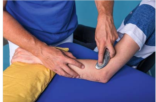
Abb. 4.1 Friktionsbehandlung mit dem abgerundeten Ende von Fazer 1.

Eine 1. Klassifizierung orientiert sich intuitiv an der Durchführung der Technik bzw. der Handhabung des Fazers. So kann man den Fazer horizontal auf der Haut des Patienten bewegen. In diesem Fall spricht man im Allgemeinen im Deutschen von Reibung bzw. im Englischen von „friction“ (► Abb. 4.1). Erfolgt die Behandlung in vertikaler Richtung, so spricht man im Deutschen