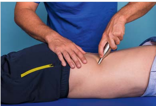
Abb. 4.8 Punktuelle Druckbehandlung mit Fazer 5 an der Lendenwirbelsäule.

teil können auch sehr tief liegende Strukturen erreicht werden (► Abb. 4.8). Auch bei adipösen Patienten ist die Länge des Instrumentes sehr hilfreich.