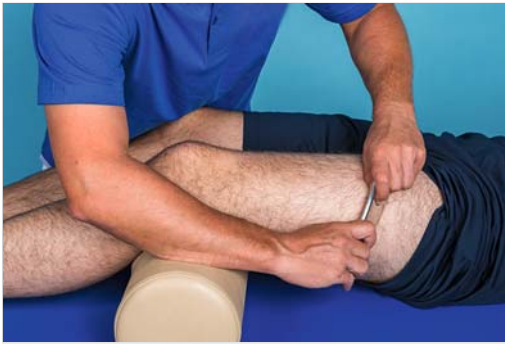
Abb. 4.13 Metabolisierungstechnik mit Fazer 1 im Bereich des lateralen Oberschenkels.

schaft. Durchgeführt wird die Metabolisierung meist mit den größeren Geräten, den Fazern 1 und 2. Doch auch hier ist der Einsatz der anderen Geräte ebenso möglich, z. B. wenn eine sehr präzise Anwendung nötig ist. Die Verwendung von Fazer-Gel als Hautschutzmittel ist hier empfohlen, auch wenn die Behandlungstiefe eher gering ist, weil die Behandlung oberflächlich erfolgt. Vor dem Hintergrund des vermuteten Wirkungsmechanismus scheint die Behandlungsrichtung unerheblich. In der Regel beginnt der Autor die Behandlung parallel zum Verlauf der Extremität bzw. der oberflächlichen Strukturen. Die Behandlungsgeschwindigkeit ist mittelschnell, also etwas niedriger als bei der Analgesierung, aber höher als bei der Rehydrierung und der Mobilisierung. Somit kann die Behandlungsfläche etwas größer sein als bei der Analgesierung. Sie ist daher meist mittel bis groß – je nach zu behandelnder Fläche.