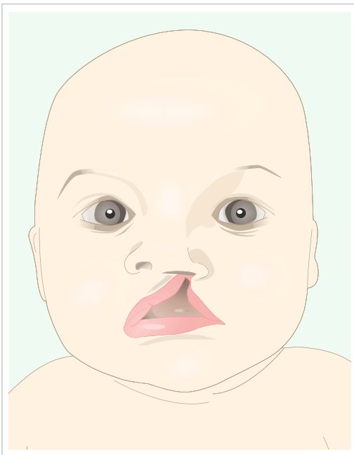
Abb. 4.10 Einseitige Lippenspalte.