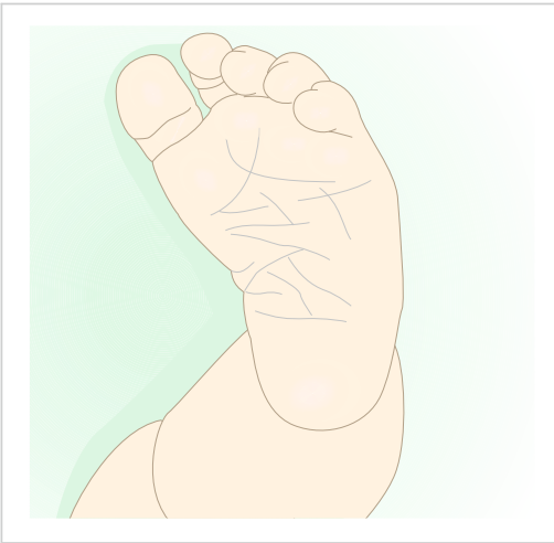
Abb. 4.11 Sichelfuß.