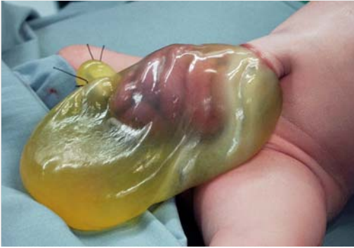
Abb. 4.13 Omphalozele (Nabelschnurbruch).

schnuransatz (► Abb. 4.13). Die Baueingeweide liegen innerhalb der Nabelschnurhaut (Bruchsack). Manchmal ist der Bruchsack rupturiert und die Eingeweide liegen frei.