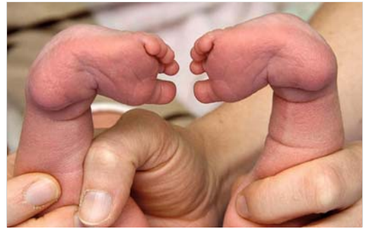
Abb. 4.12 Klumpfuß. (Quelle: Huebler H. Neonatologie. Die Medizin des Früh- und Reifgeborenen. 2. Aufl. Stuttgart: Thieme; 2019)

Zur Berichtigung (Redressement) der lagebedingten Fehlhaltung muss eine konservative orthopädische Therapie mit Gipsverband bereits in den