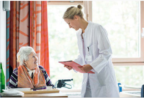
Abb. 22.4 In den ersten Tagen eines Krankenhausaufenthalts übernimmt die Kranke eine neue Rolle: Patientin.

ist für den jeweiligen Menschen oft nicht typisch, es ist nicht sein normales Verhalten. Im Grunde genommen handelt es sich aber um normale Reaktionen in einer besonderen Situation.