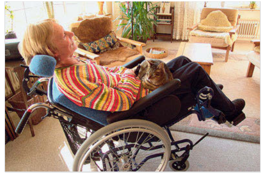
Abb. 22.1 Krankheit schränkt das Erleben ein und bringt gleichzeitig neue Erfahrungen mit sich.

Krankheitserleben wird i. d. R. mit einer Veränderung des Befindens eingeleitet. Das Wohlbefinden wird gestört und weicht dem Gefühl, krank zu sein. Hierzu gehört, dass ein Mensch nicht mehr in der Lage ist, etwas zu tun, was er vorher konnte: Er kann z. B. nicht mehr aufstehen, nicht mehr sprechen, nicht mehr essen, nicht mehr sehen, sich nicht mehr orientieren, nicht mehr Auto fahren, nicht mehr mit Werkzeugen umgehen, nicht mehr das Haus verlassen und Kontakte pflegen. Der Körper diktiert das Ausmaß des Krankseins und der Hilflosigkeit (► Abb. 22.1). Das Erleben von Schwäche und Verlust, die Empfindung von Krankheitssymptomen, wie Schwitzen, Fieber, Erbrechen, Krämpfe, Bluten, Schwindel und Schmerzen, bestimmen sein Befinden.