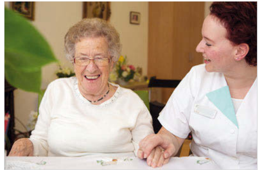
Abb. 22.2 Jeder Anlass zur Freude ist ein Gewinn und macht Kranksein erträglicher.

Wenn ein Mensch krank wird, macht er verschiedene neue Erfahrungen. Er erlebt Beeinträchtigungen und Verluste, aber manchmal auch Gewinne. In der neuen Situation kümmern sich Fachleute und meist auch Verwandte und Bekannte um ihn. Es gibt Besuche, Geschenke und Aufmerksamkeit