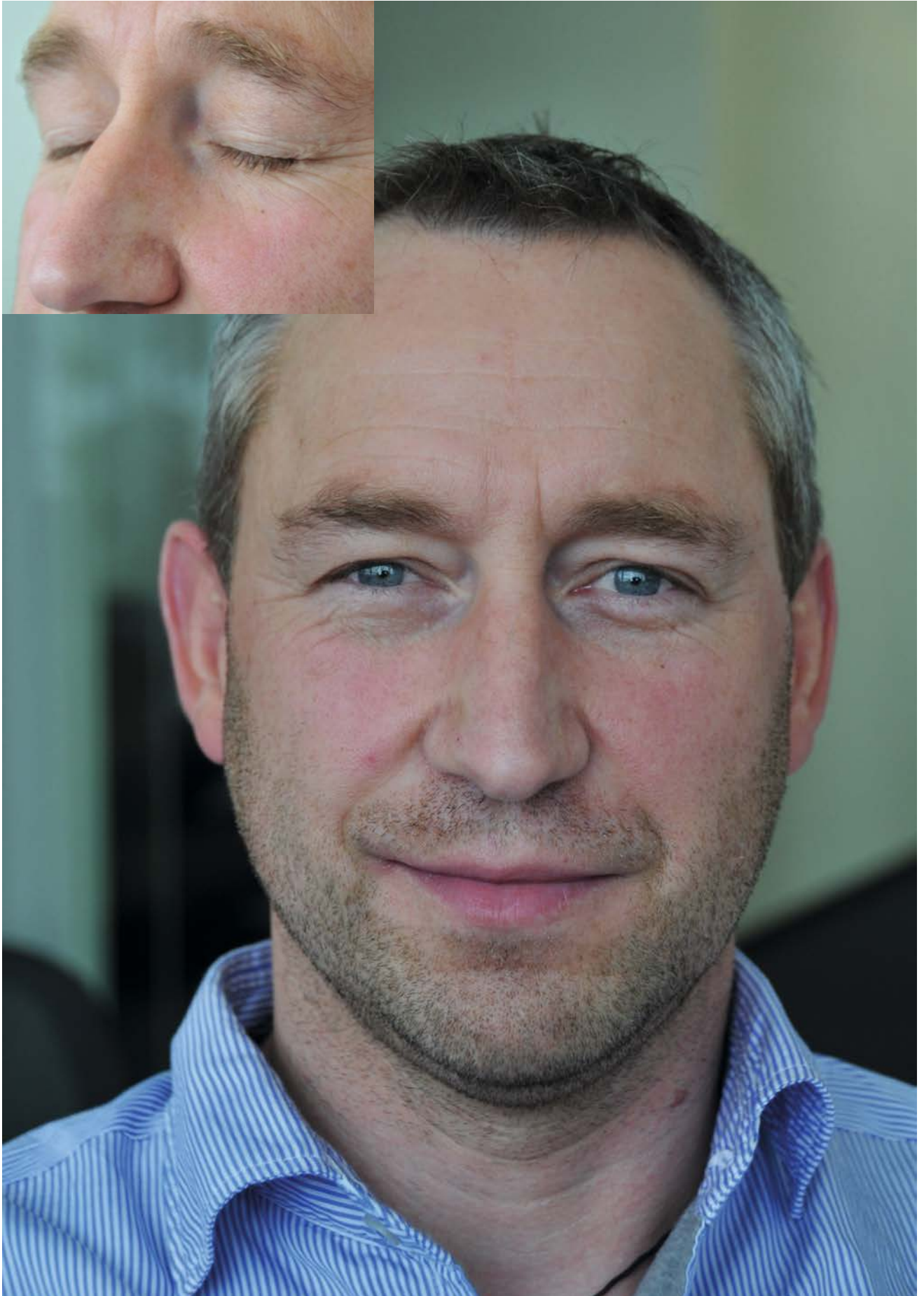
► Abb. 4.19 Erwachsene im „mittleren“ Alter (Mann).